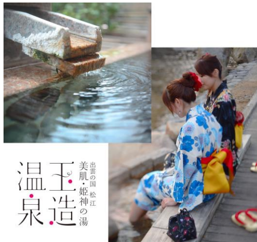
1300年前の風土記にも「美肌の湯」として紹介されている玉造温泉

にも記載される日本最古の「美肌の湯」という背景と、皮膚に対する高い保湿作用（美肌作用）を備える松江市の観光資源です。歴史ある観光資源、美肌の湯「玉造温泉水」を、化粧品として全国に流通させることで地域素材・観光資源のPR効果につなげることを目的とした事業です。